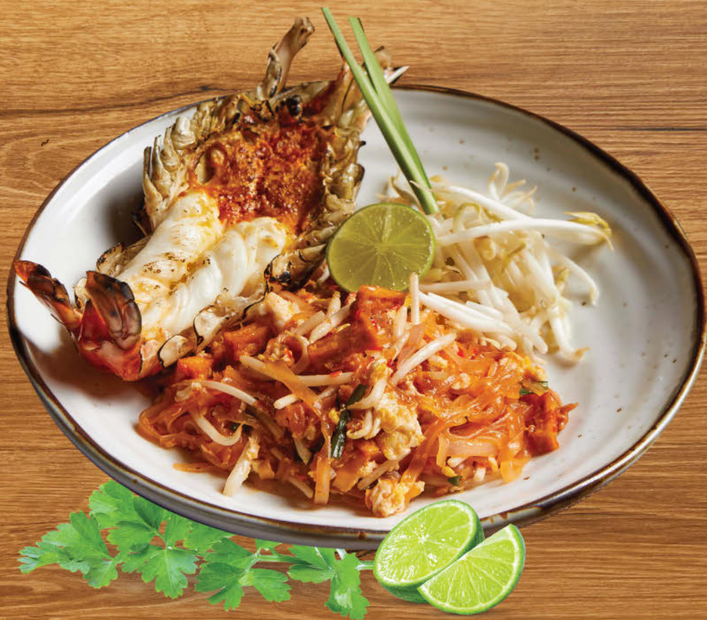
ผัดไทยกุ้งแม่น้ำ 780 Stir fried rice noodle with river prawn, tofu, egg, beansprout and tamarind sauce