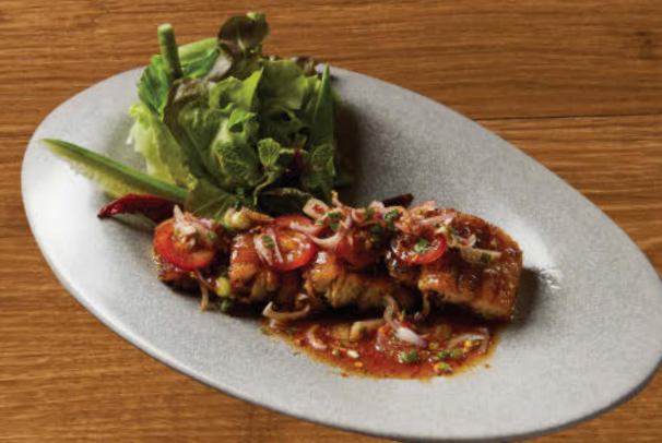
ปลาอุกย่างน้ำตก 480 Grilled catfish topped with Thai spicy sauce, roasted rice powder, spices and marinated cucumber