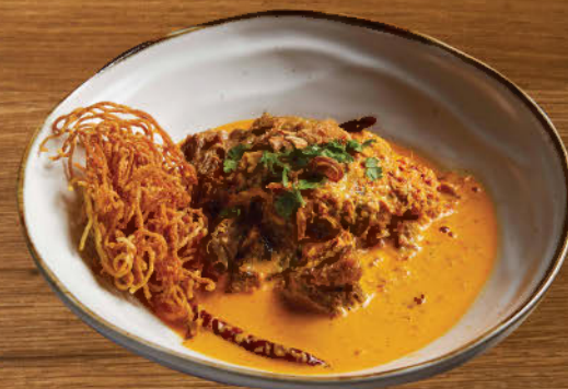
ข้าวซอยเนื้อแก้มวัว/ไก่ 370 Northern style coconut yellow curry with egg noodles, braised beef cheek or chicken thigh and topped with crispy noodle