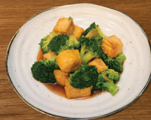
ผัดบล็อกโคลี่ 280 Stir-fried broccoli and custard tofu Klong Ngae with soy sauce and oyster sauce