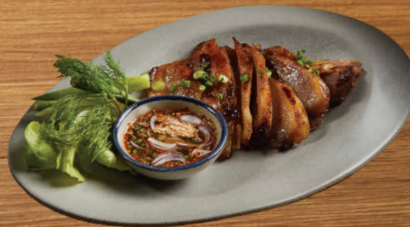
คอหมูย่าง 450 Grilled pork neck