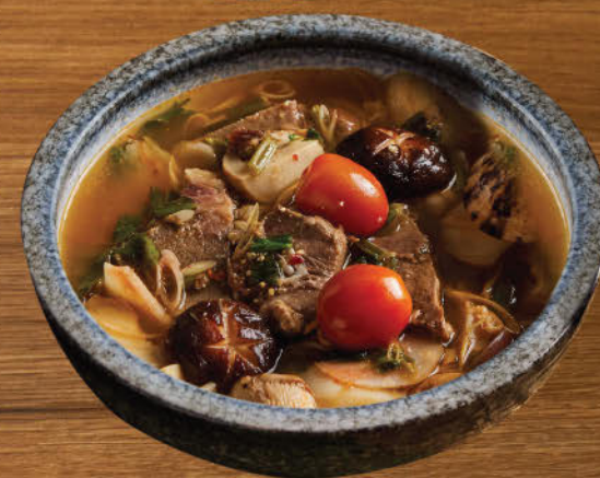
ต้มแซ่บสตูลิ้นวัว 680 Spicy and sour ox tongue soup "Northern style"