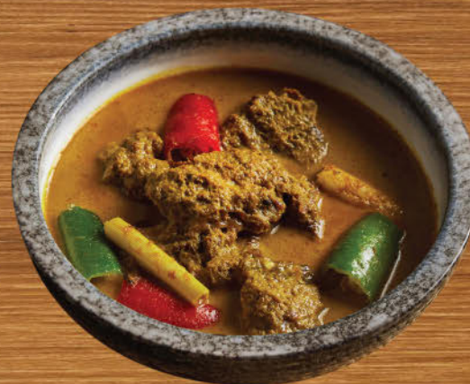
แกงระแวงเนื้อ 680 Beef cheek turmeric curry with lemongrass