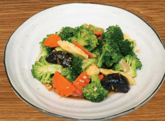
ผัดผักสามสหาย 280 Stir-fried broccoli, baby corn and carrots with soy sauce and oyster sauce