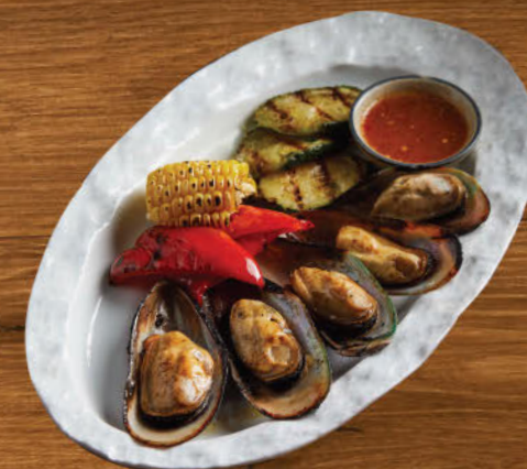
หอยแมลงภู่นิวซีแลนด์ 420 New Zealand mussel