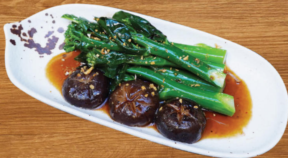
กะน้าฮ่องกงซอสเห็ดหอม 300 Wok-fried Chinese kale and Shiitake mushroom with mushroom sauce