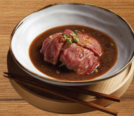
ก๋วยเตี๋ยวน้ำตกเนื้อวากิว 680 Rice noodles and wagyu beef in hot and spicy enriched-soup