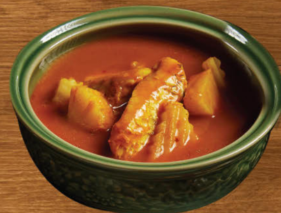
แกงเหลืองปลากะพง 420 Southern Thai spicy and sour yellow curry with seabass and coconut tips