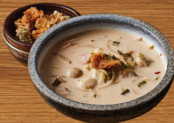
ต้มข่าหัวปลีปลาสลิดทอด 480 Banana blossom and deep fried gourami in galangal coconut milk soup