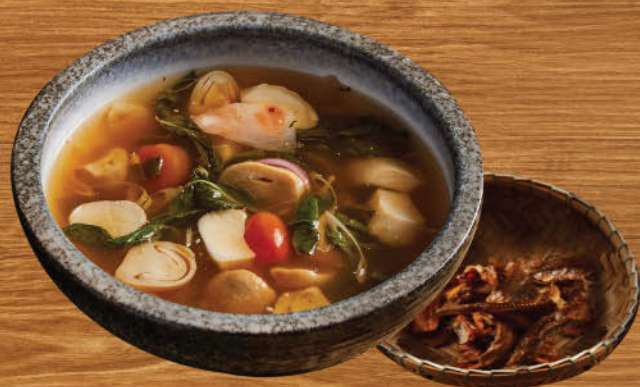
ต้มโคล้งปลากรอบ 480 Spicy and sour smoked dried fish soup