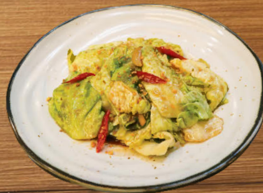
ผัดผักกะหล่ำหัวใจ 280 Stir-fried pointed cabbage with chili, garlic, soy sauce and oyster sauce