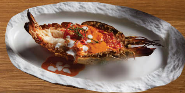
กุ้งย่างแม่น้ำ 950 Grilled river prawn with red curry sauce