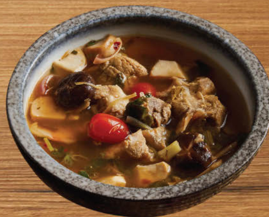
ต้มแซ่บกระดูกอ่อน 480 Esan style spicy hot and sour pork ribs soup