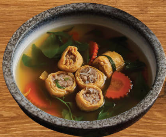
แกงจืดยอดผักหวาน ไข่มวนหมูทรงเครื่อง 480 Clear soup with wild Thai forest vegetables and egg roll with marinated minced pork