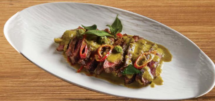
แกงเขียวหวานเนื้อวากิว 690 Grilled Wagyu beef green curry