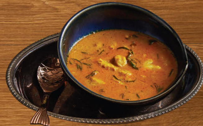
แกงคั่วปูใบชะคราม 890 Crab meat and seabite leaves curry "Southern style"