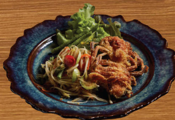
ส้มตำปลาร้าปูนิ่ม 680 Famous Thai papaya salad with crispy fried soft-shell crab and "Pla Rah" Thai fermented fish