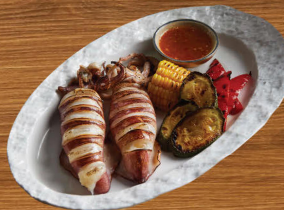
ปลาหมึกทะเลตราด 680 Sea squid from "Trad" Eastern province