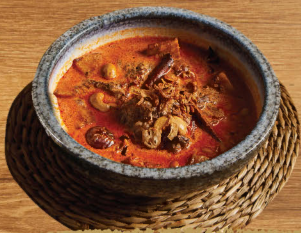
มัสมั่นเนื้อแก้มวัว 680 Beef cheek "Massaman" curry