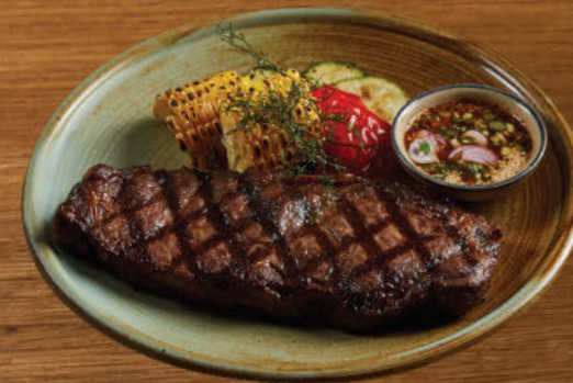
เนื้อวัวออสเตรเลีย 2,300 Australian beef striploin (300 g.)