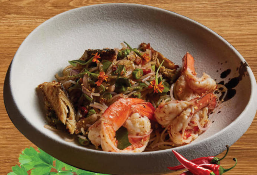
ยำขนมจีนกึ่งกับปลาหู 480 Northeastern style fermented rice noodle salad with prawns and mackerel fish