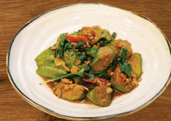
ผัดมะเขือยาวใบโหระพาหมูสับ 350 Stir-fried eggplant with minced pork, chili and sweet basil

Prices are subject to a 7% VAT and a 10% service charge.