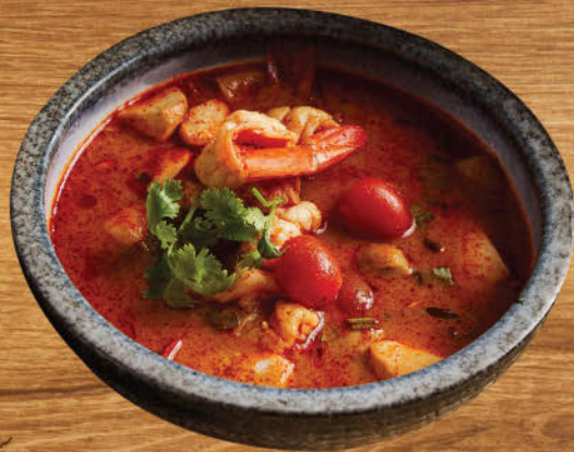
ต้มยำกุ้งมะพร้าวอ่อน 580 "Tom yum" famous Thai spicy prawn soup with young coconut