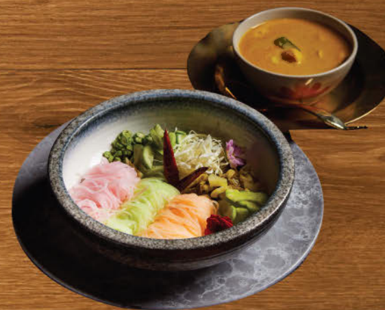
ขนมจีนน้ำยาปู 780 Crab meat curry with fermented rice noodle