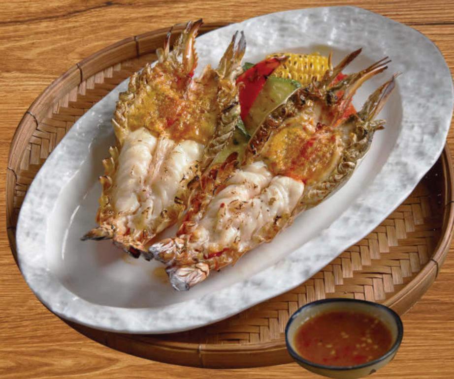
กุ้งแม่น้ำ 1,500 River prawn