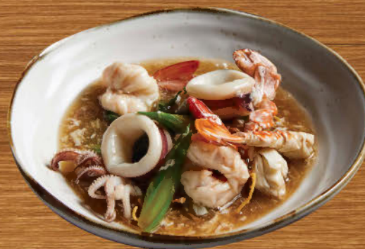
ราดหน้า อารา นาวา 590 Deep fried egg noodle in mix seafood gravy sauce