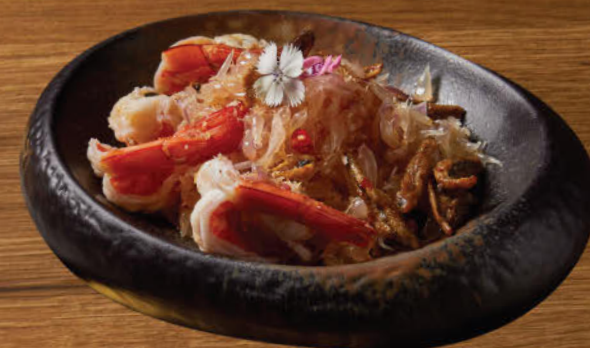
ยำส้มโอ 580 Spiced pomelo and prawns salad topped with dried Southern crispy fish