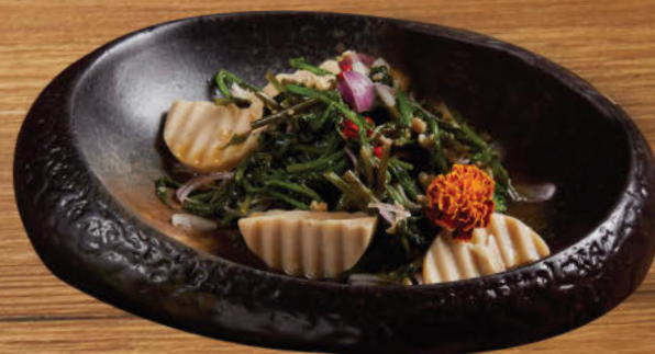
ยำผักกูดสองหมู 380 Southern vegetable salad with Vietnamese pork sausage and minced pork